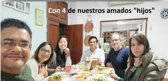
Con 4 de nuestros amados "hijos"